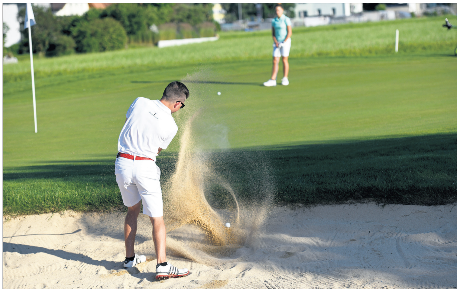
Golf fordert technisches Können wie auch mentale Stärke – etwa bei einem Schlag aus dem Bunker.